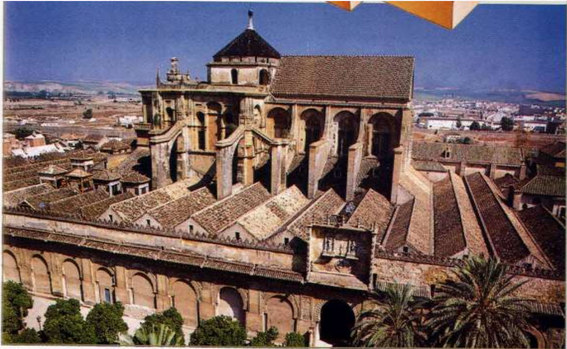
من البرج يمكن ملاحظة صلابة وضخامة جدران المسجد القرطبي الأعظم