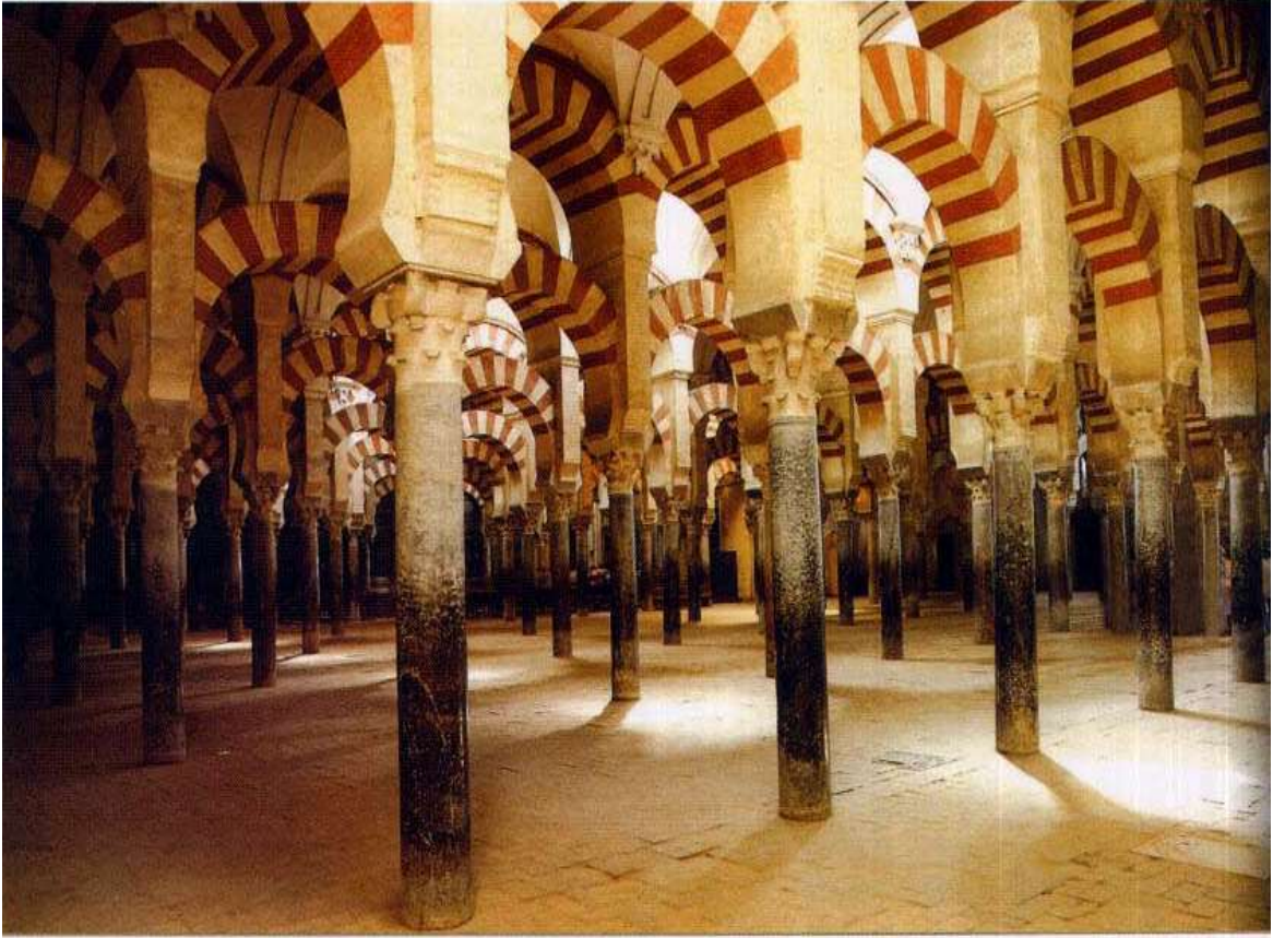
عدد هائل من الأعمدة داخل مسجد قرطبة