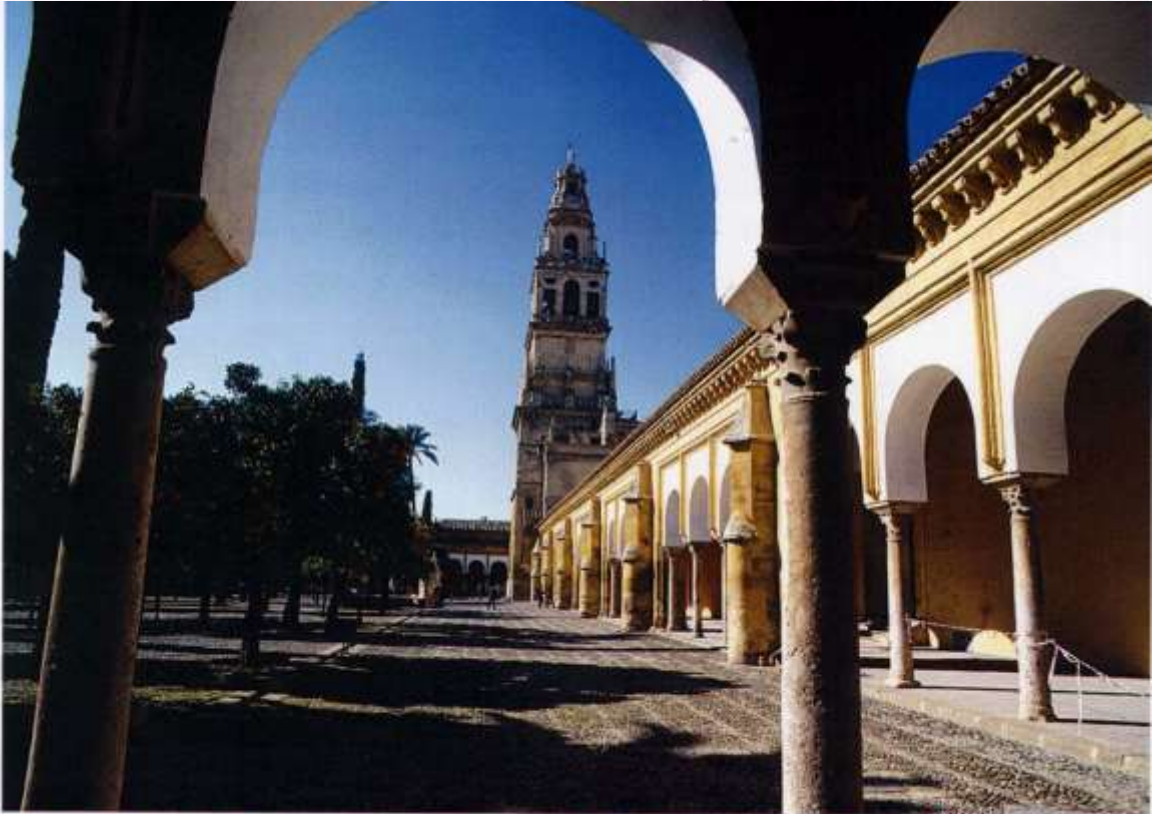
متنظر لقناة مسجد قرطبة وقد حول إلى مزار للسياح وأوقفت فيه الصلاة والعبادة منذ خروج المسلمين من الأندلس إلى الآن - فتراه يحن الصوت مؤذن الصلاة وقراءة القرآن وخشوع المسلمين ...