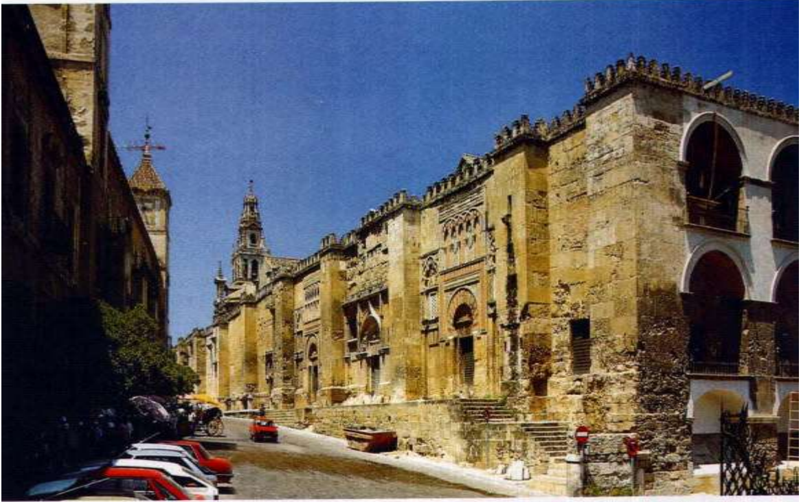
خارج مسجد قرطبة الكبير، أكبر جامع في العالم الإسلامي بعد مكة